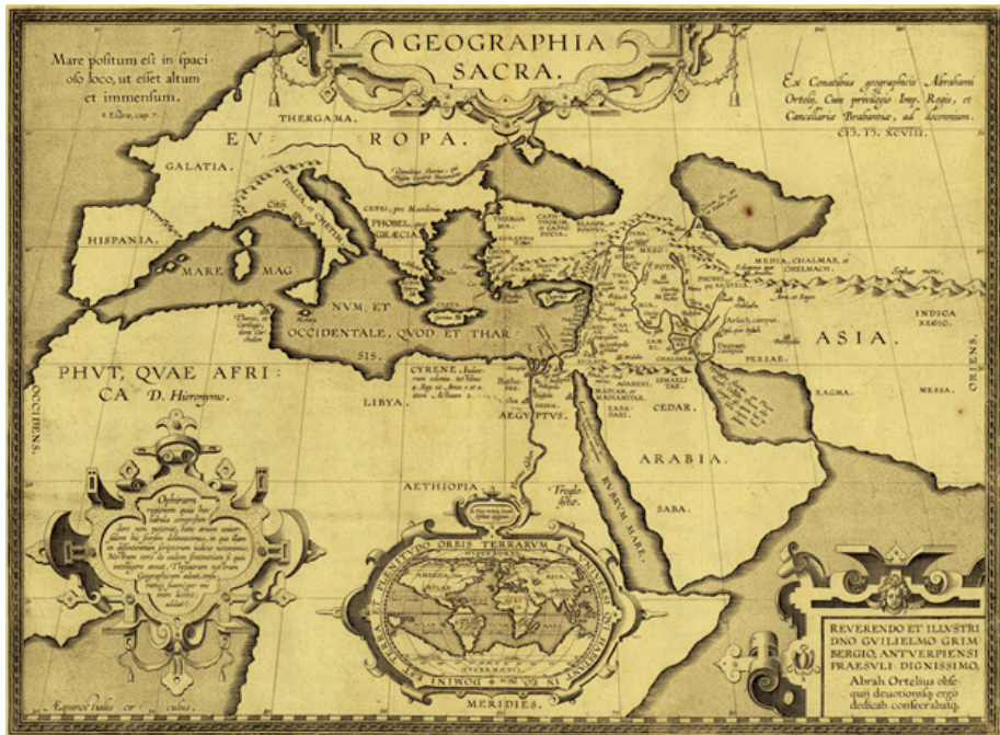
Fig 2. Ortelius, A. Geographia Sacra , 1579.